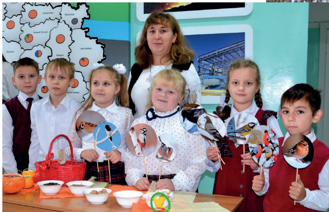
Второклашки подготовили лакомства для птиц

– Благодаря гранту и спонсорской помощи закупили оборудование: фотоаппарат, фотоловушка и бинокли, в том числе цифровой. Можем не только наблюдать за птицами, но и вести качественную съёмку, запечатлеть пернатых в их естественной среде обитания. Мы собрали уже немалый архив фото- и видеоматериалов. Особенно помогли фотоловушка. Устанавливаем их