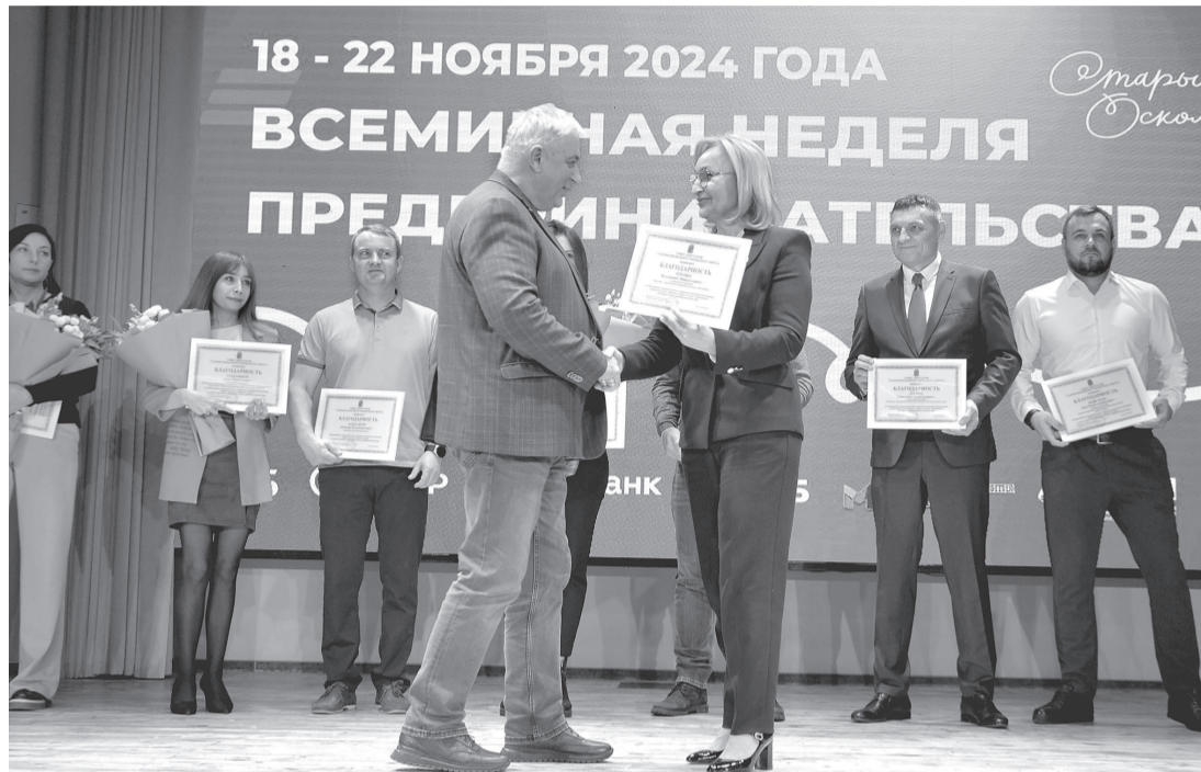
Предпринимателей отметили муниципальными наградами

Не обошли и тему поддержки участников специальной операции. Представители малого и среднего бизнеса активно участвуют в волонтерской деятельности, буквально ежедневно отправляя на фронт необходимые грузы для бойцов.