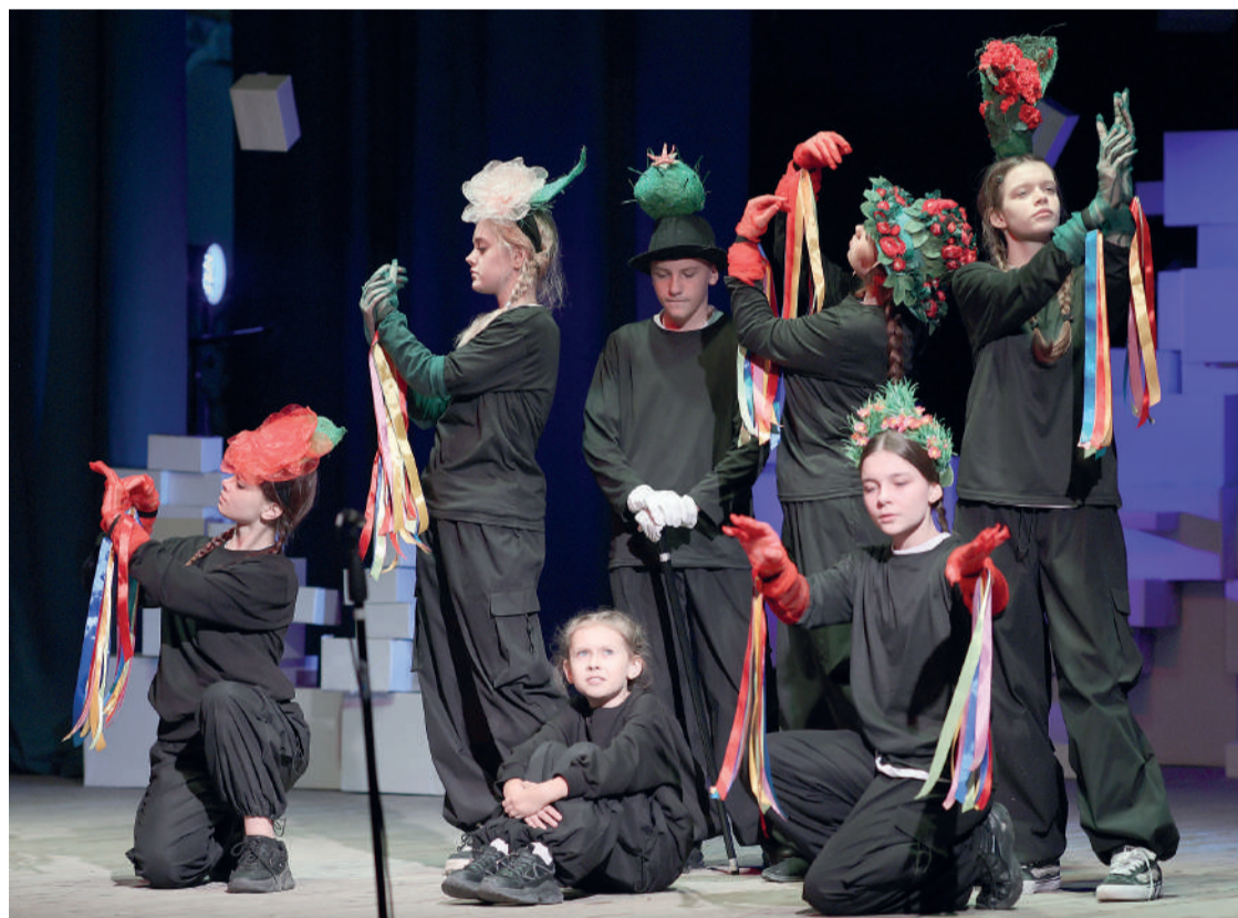
Сцена из спектакля «Мир тишины»

Проект театра «Геликон-опера» покорила сердца старооскольцев