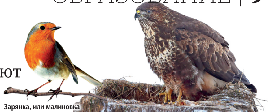
Зарянка, или малиновка

Ученики Городищенской школы изучают орнитофауну Белгородчины